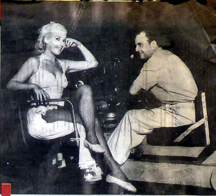
La impactante Elina Colomer, una de las diosas de los años '50.

de la actriz. Un día salió corriendo del canal para tirarse debajo de un coche que pasaba por la calle Castex (la salvó Paquita Vehil). Entonces, todo el mundo se enteró de su desgracia, de su vía crucis. Algunos se volcaron a defenderla. Otros insistieron en que "Está pagando todo lo que hizo". Claro que ninguno pudo explicar fehacientemente de qué era culpable, en forma total, Fanny Navarro. En todo caso, era la víctima de un sistema. No pudo seguir más en el canal. Su vida se desenvolvió, hasta 1970 en que se fue de este mundo, cuando su corazón dijo "basta". Se dijo que apenas pasaba los 50 años cuando cerró sus ojos. Su muerte culminaba un calvario. Una tragedia tremenda de la farándula nacional. Fanny Navarro no mereció, como ser humano, semejante condena. Por eso es que en lugar de hacerle mal, sus detractores la convirtieron en una mártir. Tal lo que fue. Elina, al terminar (en el '69) "La familia Falcón" (uno de los últimos éxitos) no encontró un respaldo semejante. Su voz se iba cascando cada vez más y cuando la llamaron para hacer el rol de la mujer de un travesti en "La jaula de las locas", en siniestro reducto de Ave-