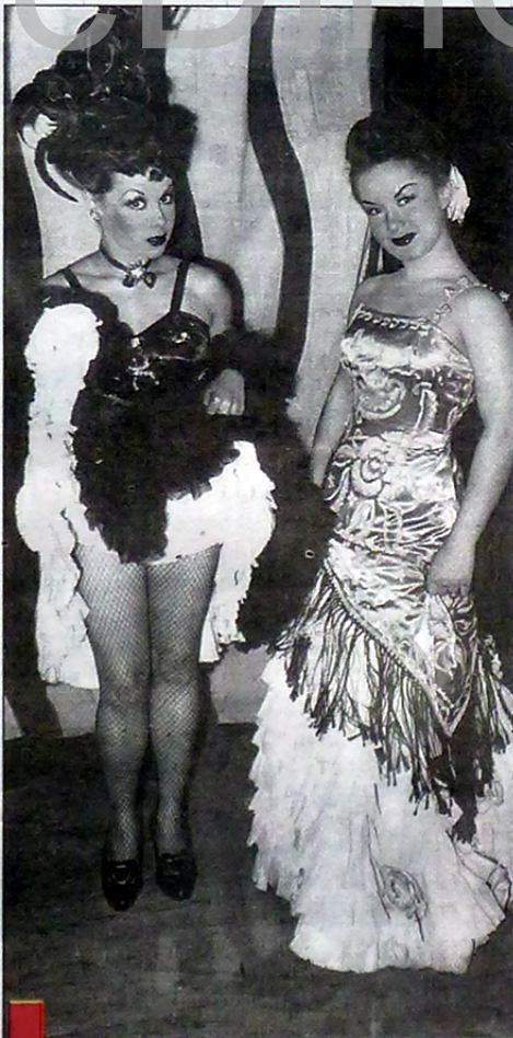
La famosa Fanny Navarro junto a la no menos conocida Lolita Torres, en una obra que las tuvo como estrellas.

total. Se veía perseguida, ateneada. No entendía cómo le cargaban culpas del pasado que ella había declarado inexistentes. Su sola vinculación amorosa con Juan Duarte había llegado a exacerbar a todo el mundo de una manera irracional. Fanny encarnaba a una prisionera (rol similar al que cumplía en su gran trabajo para el cine en "Deshonra") en uno de los dos teleteatros y en cada ocasión debía entregar, como las demás actrices, su camión para que lo higienizaran. En una oportunidad le dieron, equivocadamente, el que pertenecía a María Aurelia Bisutti. Esta sabía que era el suyo porque le había bordado unas iniciales en la parte interior. Cuando María Aurelia buscó afanosamente su camión se enteró de que lo tenía Fanny. Y esto la irritó y la molestó mucho por tratarse de una prenda íntima. Toda la guerra fría que le hicieron quebró la resistencia