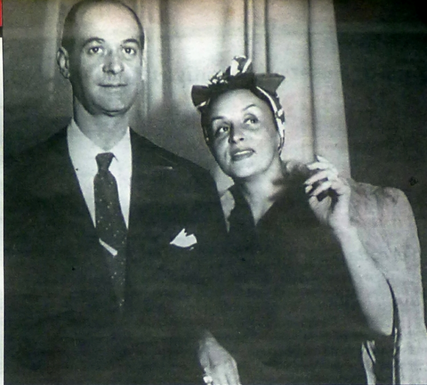
Luis Sandrini y Tita Merello durante sus años de felicidad plena. Luego, él rompió la relación.

"Mientras Luisito era figura obligada en estas fiestas del ambiente -y el mes que finaliza fue pródigo en ellas-, Tita se retrajo a todas... ¿Qué ocurría con nuestra simpatísima actriz y cancionista? ¿Cuál era el motivo de sus ausencias? Pues nada menos que