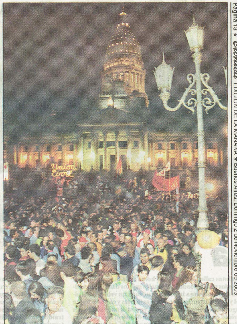
Multitudinaria presencia gay, estimada en 15.000 personas.

En las paredes de la Catedral, los manifestantes pintaron leyendas como "Iglesia igual Dictadura" y "curas violadores". Afortunadamente, la cosa no pasó a mayores.