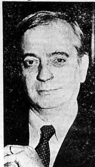
Juez Enrique Petracchi: otro voto a favor

La Corte Suprema de Justicia negó ayer mediante un fallo la personería jurídica a la Comunidad Homosexual Argentina (CHA). El dictamen, con siete votos a favor y dos en contra, se conoció una semana después que el presidente Carlos Menem aseguró en los Estados Unidos que había dado expresas instrucciones a sus colaboradores, entre ellos al ministro de Justicia, León Arslanian, para que se le otorgara definitivamente un marco legal a la CHA.