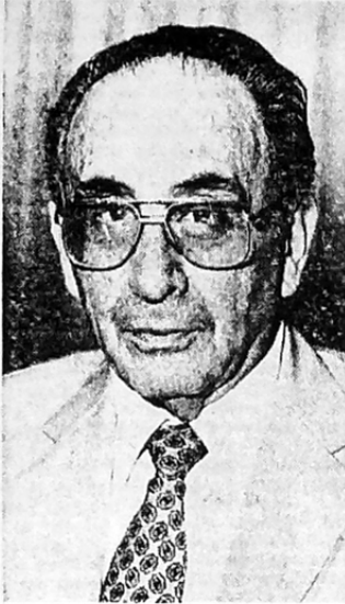
Juez Santiago Fayt: un voto a favor