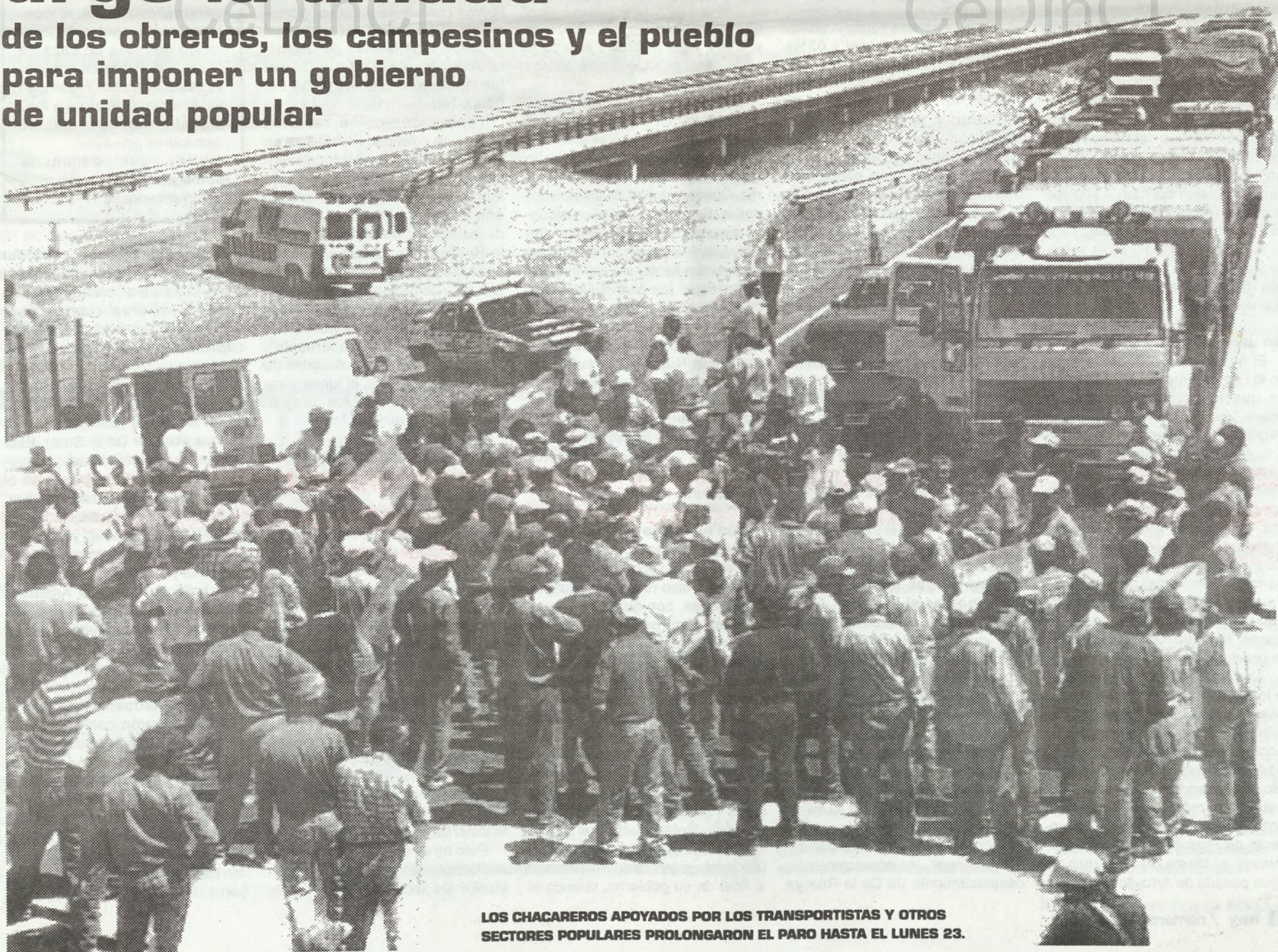
LOS CHACAREROS APOYADOS POR LOS TRANSPORTISTAS Y OTROS SECTORES POPULARES PROLONGARON EL PARO HASTA EL LUNES 23.

de los obreros, los campesinos y el pueblo para imponer un gobierno de unidad popular