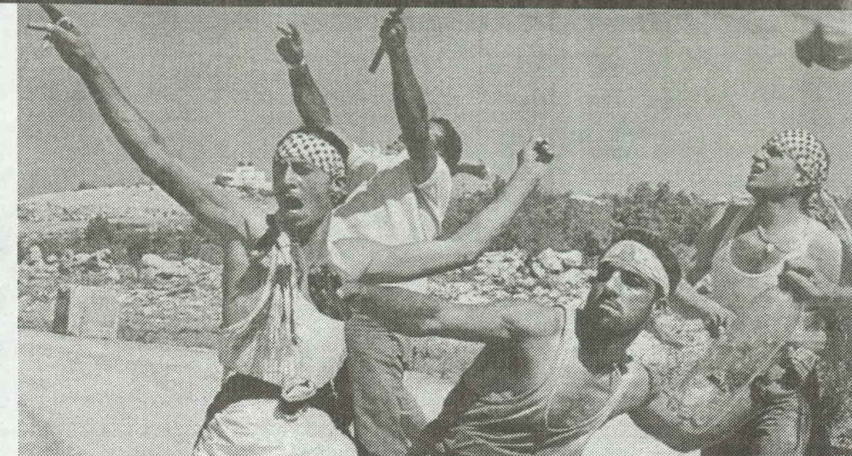
EL ÚLTIMO FIN DE SEMANA RECRUDECIÓ LA "GUERRA DE LAS PIEDRAS" DEL PUEBLO PALESTINO.

Medio Oriente: la mecha sigue encendida. El ocupante sionista sigue haciendo correr la sangre palestina. La Intifada y la mano de los imperialismos definen posiciones entre los países árabes. ¿Hacia la guerra abierta?