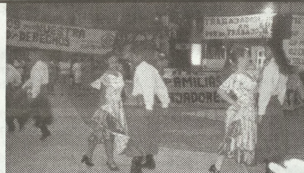
MUCHOS ARTISTAS PARTICIPARON DEL FESTIVAL SOLIDARIO.

El sábado 21 se realizó un festival en la plaza Alsina de Avellaneda como parte de la solidaridad con la lucha de Gip-Metal. Convocado por sindicatos, agru-