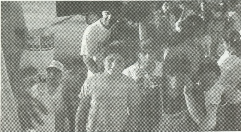
EL PARO CONCITÓ LA SOLIDARIDAD DE OTROS SECTORES POPULARES. ARRIBA: REPARTO DE LECHE A LA ENTRADA DEL SUBFLUVIAL.