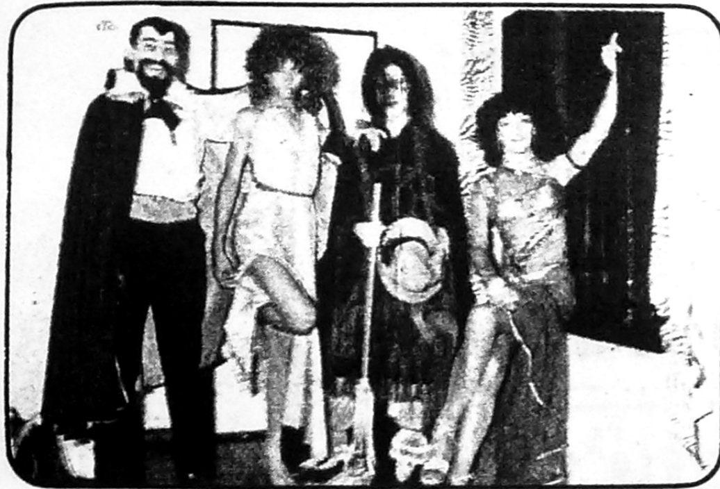
Desinhibidos y desprejuiciados. Así se comportaron los integrantes del ambiente "gay" en un baile de disfraces realizado en una importante boîte de la zona de Ramos Mejía. No faltó nada. Alegria, diversión y todos los chiches...

"La homosexualidad es legal en la Argentina después de los 22 años. La actitud oficial es de disgusto y la tolerancia a menudo es nula. Por ello se te advierte actuar con precaución. La mayoría de los clubes, cafés y establecimientos anotados es mixta y de ambiente artístico. Algunos lugares pueden tener una clientela especialmente homosexual durante los fines de semana, mientras que otros particularmente aquellos situados a lo largo de la Avenida 9 de Julio, son bastante tranquilos a cualquier hora. Los verdaderos bares homosexuales tienden a ser oscuros, tranquilos, agradables y reposados. Aunque, al principio, los argentinos parecen distantes, a menudo actuarán con reservas hasta que te conozcan mejor. A no ser que te alojes en un hotel de lujo, pasar supuestamente a un chico a tu habitación por la noche es difícil. Este debería registrarse en la recepción, lo cual tal vez no le convenga. Buenos Aires te gustará. Es una hermosa ciudad de regio aspecto. Su ambiente combina lo mejor de Nueva York y París, aunque permaneciendo genuinamente argentina. Por lo general los argentinos son de una belleza clásica, descendientes de una pura raza ibera, elegantes en su manera de vestir. Para sentarte en un café por