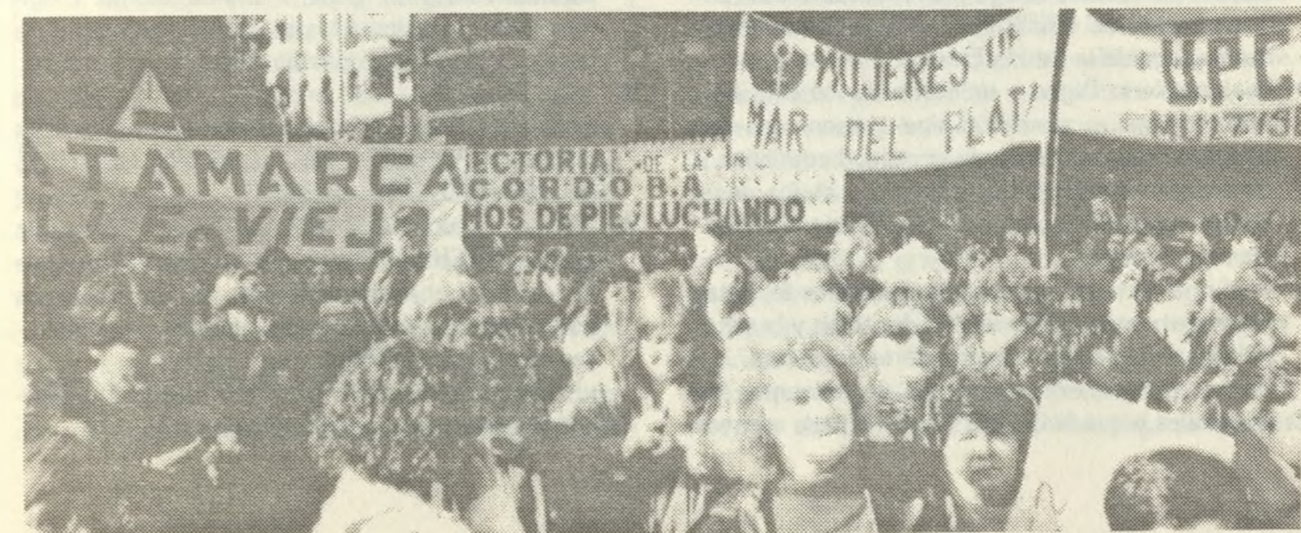
XI ENCUENTRO NACIONAL DE MUJERES - BUENOS AIRES - 8, 9 Y 10 DE JUNIO DE 1996

Se dio una discusión en cuanto al saber como poder, como capacidad de transformación. El poder como espacio de dominación, como apropiación de las formas del poder institucional.