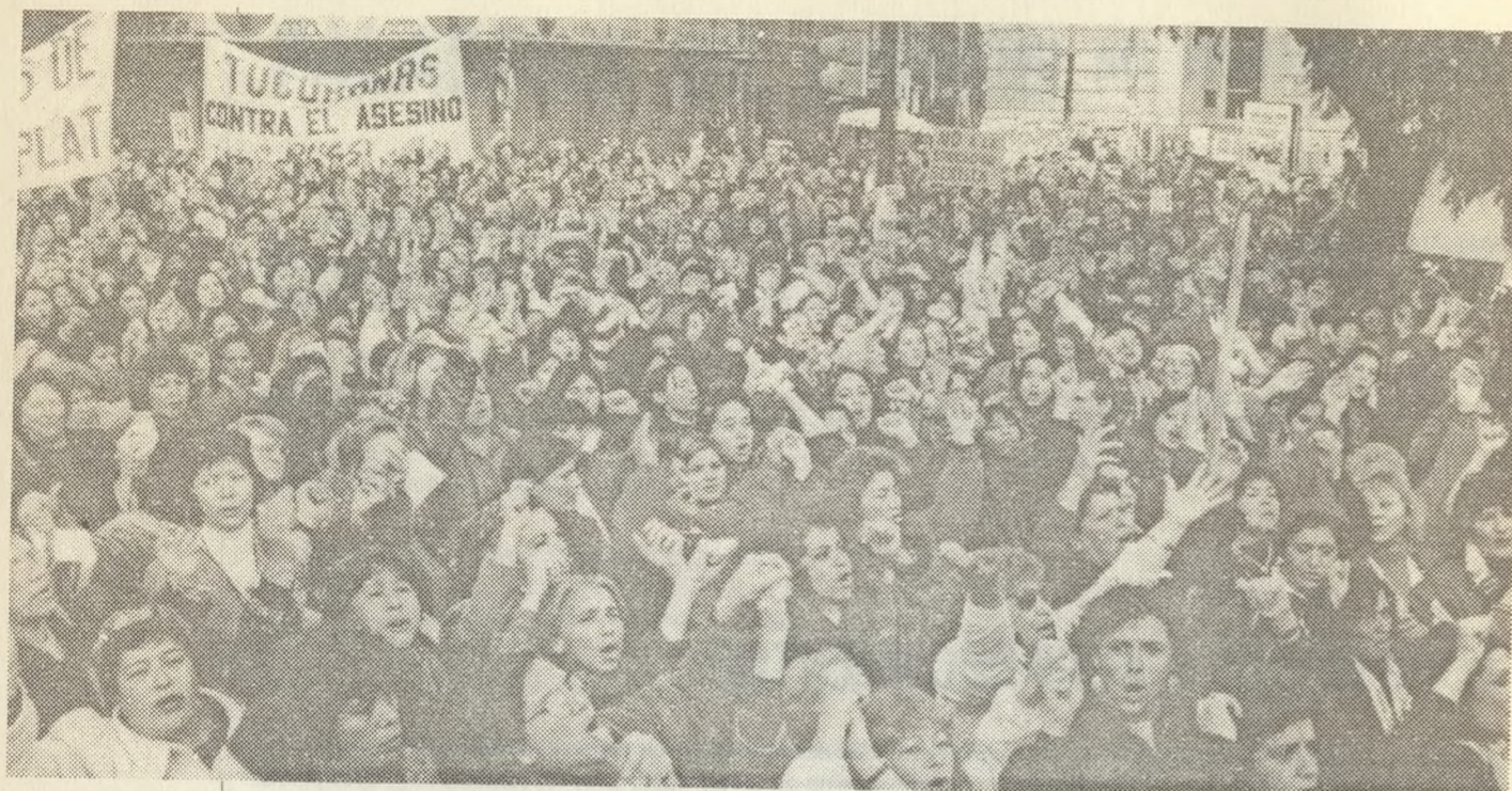
MOMENTOS PREVIOS AL CIERRE DEL ENCUENTRO.