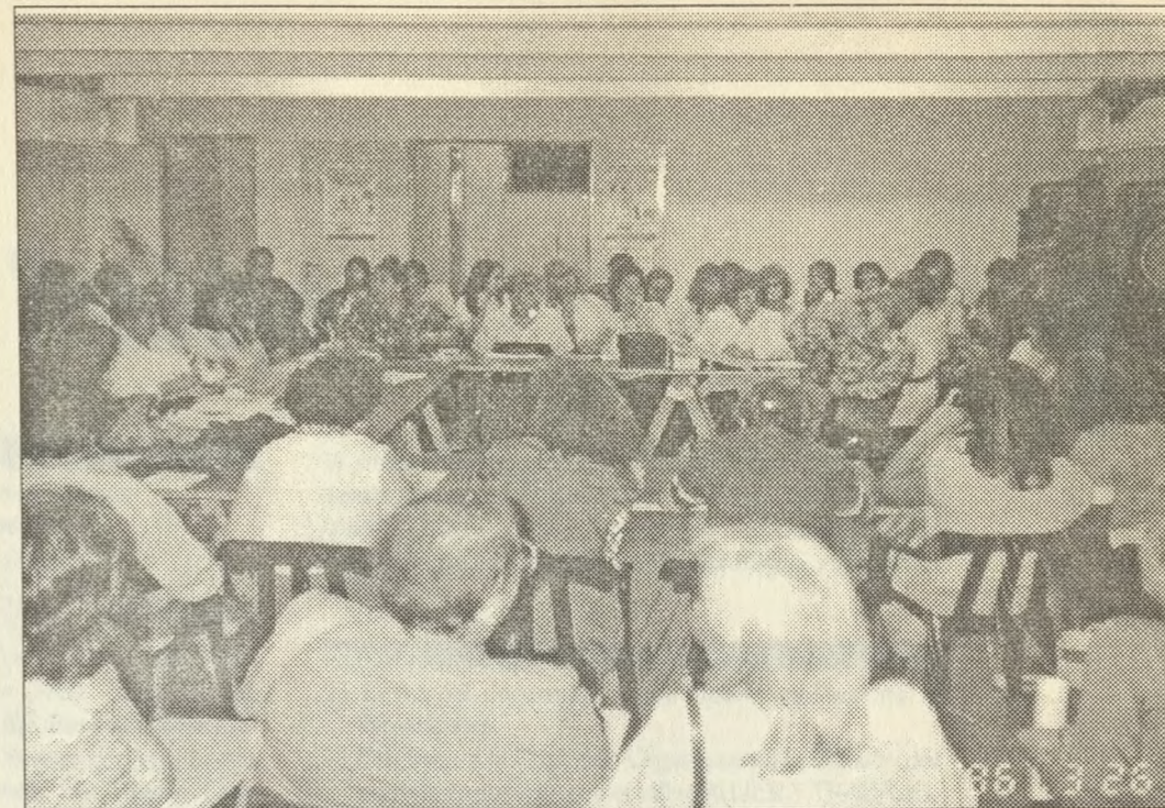
REUNION PLENARIA DE LA COMISION ORGANIZADORA

Estamos aquí y vamos a luchar para que la discriminación, la subordinación, el hambre, la desocupación, la corrupción, la exclusión social, la impunidad y la injusticia, sean eliminadas definitivamente.