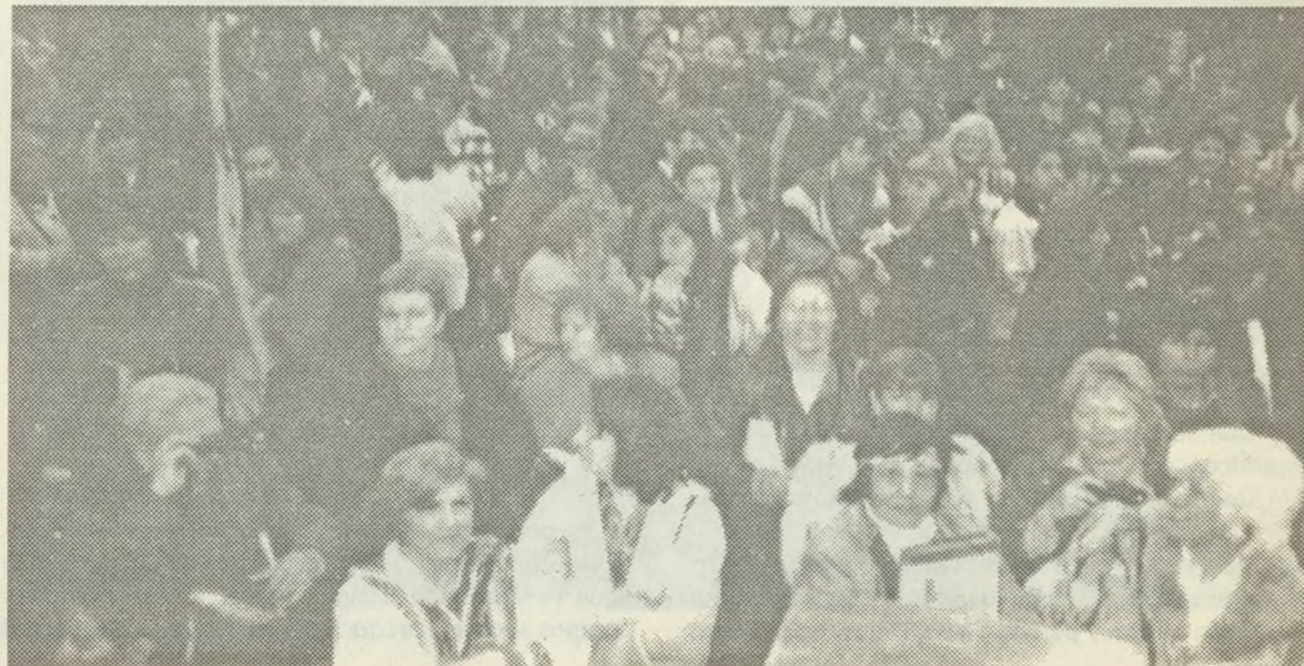
VISTA PARCIAL DE LAS MUJERES QUE PARTICIPARON EN LA INAUGURACION DEL ENCUENTRO.

Las mujeres nos convocamos a trabajar desde nuestras organizaciones básicas, fomentando la crea-