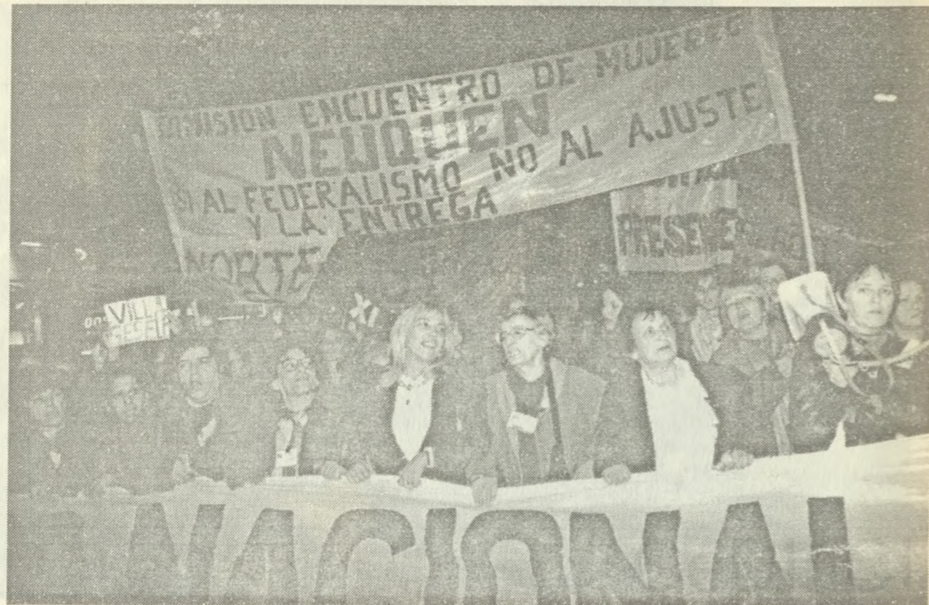
MARCHA POR LAS CALLES DE BUENOS AIRES, EL DIA 8 DE JUNIO DE 1996.

La implementación de políticas de ajuste profundizan la desigualdad y discriminación de facto entre los géneros. Estas nos afectan proporcionalmente más a las mujeres; especialmente a las de sectores populares. Aumentan nuestras horas de trabajo fuera