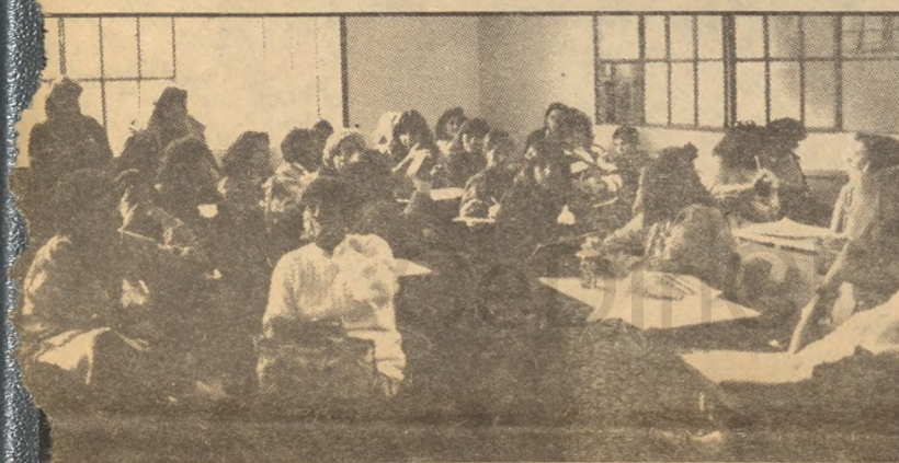
Taller de Trabajo donde participaron las compañeras.

— En mi caso particular, soy contratada. Tenemos trabajo cuando ellos quieren, cuando tienen muchos pedidos; es decir, somos tapaagujeros, como ellos nos llaman. Yo me referí en el taller a que desgraciadamente las operarias que somos contratadas, o trabajamos, no tenemos derecho a ser madres y no tenemos. Esa es la cruel realidad de la mujer contratada. Cada mes nos hacen estudios de embarazo, un Gravidex, para ver si ellos de que no estamos embarazadas, porque con esas pesadas que tenemos no es factible abortar un emba-