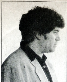
Almodóvar, un cineasta que no se priva de nada a la hora de hacer combinaciones sexuales, perturbó en "La ley del deseo" con la apasionada pareja Eusebio Poncela-Antonia Banderas.

Por otra parte, el 24 de junio pasado se presentó en los Estados Unidos el piloto del programa In the Life , por televisión abierta. Se trata de una producción que aspira a ser mensual y comenzaría a emitirse en setiembre si se solucionan los problemas de financiación. De corte artístico-periodístico, In the Life intenta explorar la vida y la cultura de gays y lesbianas norteamericanos en un momento en que esa comunidad se considera en estado de alerta por casos de discriminación. Y por la forma en que se ha encarado el problema del SIDA durante la última década. Como nunca desde que los homosexuales salieron a la luz y empezaron a manifestarse de diversas formas, su temática aparece profusamente en novelas, piezas teatrales, películas. Hace una semana, por la cadena ABC, en la