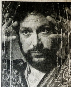
Harvey Fierstein, autor y actor de éxito ("Amor, extraño amor"), especializado en personajes y temas relativos a la homosexualidad.

telenovela One Life to Live , se vio a un adolescente de 16 años que anunciaba que era gay, situación que modificó la trama y sirvió para explorar la homofobia en una comunidad.