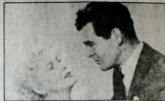
Joan Fontaine se guarda a Robert Ryan (¿se acuerda?).